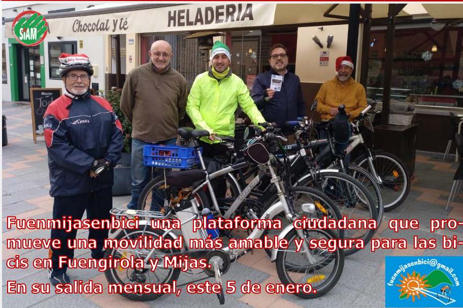
Fuenmijasenbici una plataforma ciudadana que promueve una movilidad más amable y segura para las bicis en Fuengirola y Mijas. En su salida mensual, este 5 de enero.

El equilibrio que tendrá que marcar nuestra responsabilidad a la hora de tomar decisiones sobre los alimentos que ingerimos y el compromiso con la emergencia climática, será fundamental para frenar el calentamiento global.