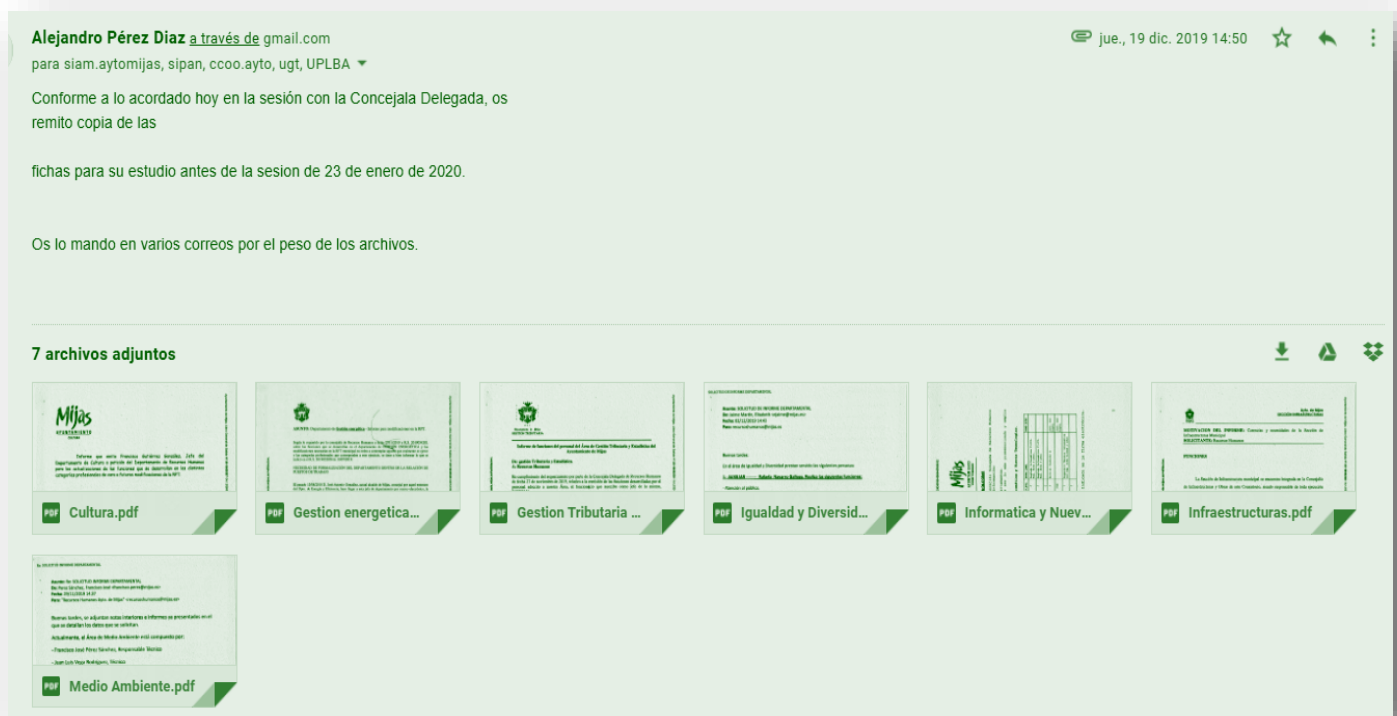
Uno de los correos electrónicos recibidos con informes para evaluar superior categoría y RPT.

Estas dos cuestiones, una nueva y completa RPT y la OEP 2020, son objetivos fundamentales para deshacer la auténtica torre de babel en la que se ha convertido la plantilla municipal con un sinfín de categorías superiores realizándose, que son pan para hoy y hambre para mañana, pues son situaciones precarias que no admiten consolidación y por tanto pueden devenir en un retorno a la situación inicial con la consiguiente bajada salarial para quienes las están desempeñando.